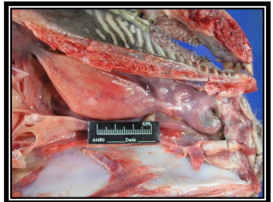
圖：口腔、嘴唇及舌等黏膜組織大小不一丘疹及小水泡，口、唇嚴重潰瘍灶