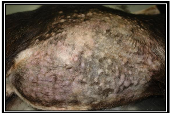
圖：皮膚出現突起之硬實結節