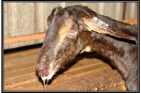
圖：口、唇、臉部周圍小紅疹、丘疹、圓型潰瘍及結痂等病變