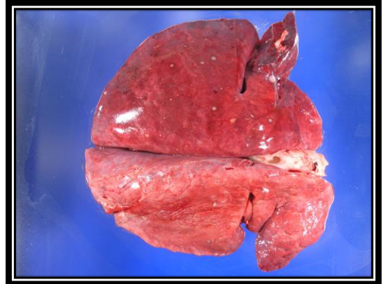
圖：肺濕重潮紅表面密佈直徑 0.2-0.5 cm 大小硬實白色突起圓形結節