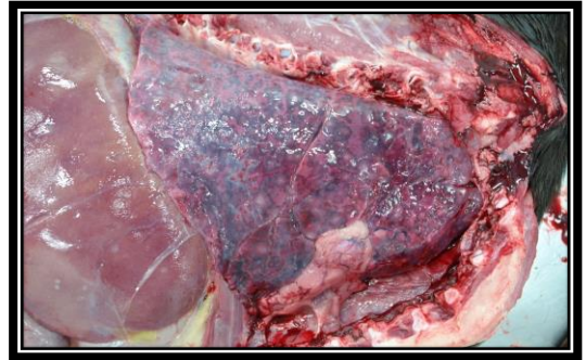
圖：纖維素性胸膜肺炎肺濕重潮紅