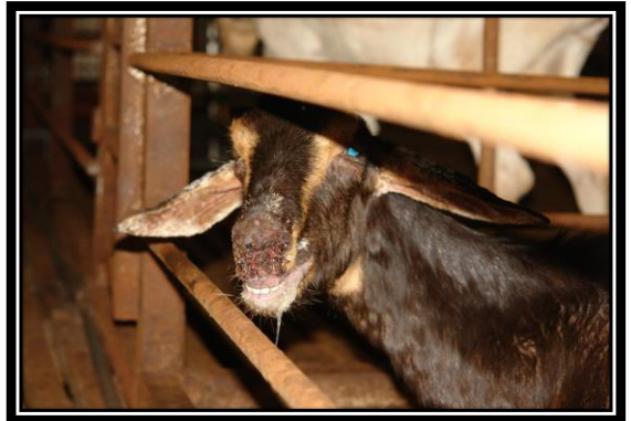
圖：口、唇、臉部周圍小紅疹、丘疹、圓型潰瘍及結痂等病變