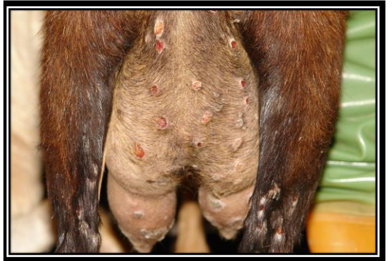
圖：乳房皮膚組織小紅疹、丘疹、圓型潰瘍及結痂等病變