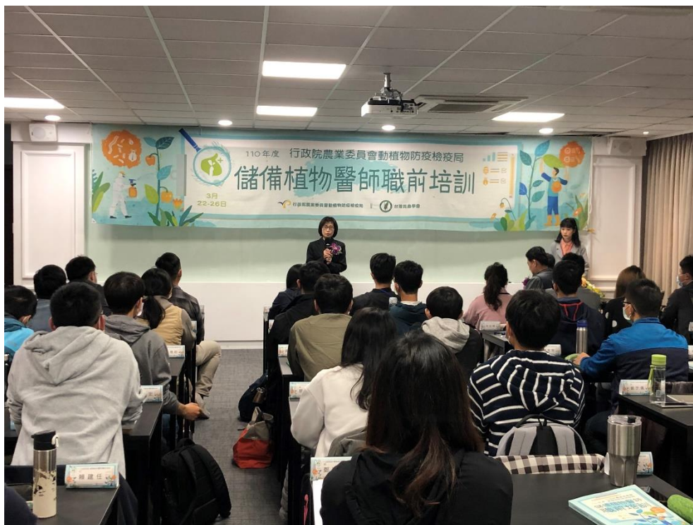
圖 4、110 年於臺中市霧峰區議蘆會館舉辦「儲備植物醫師職前培訓」課程，強化專業人力培訓。