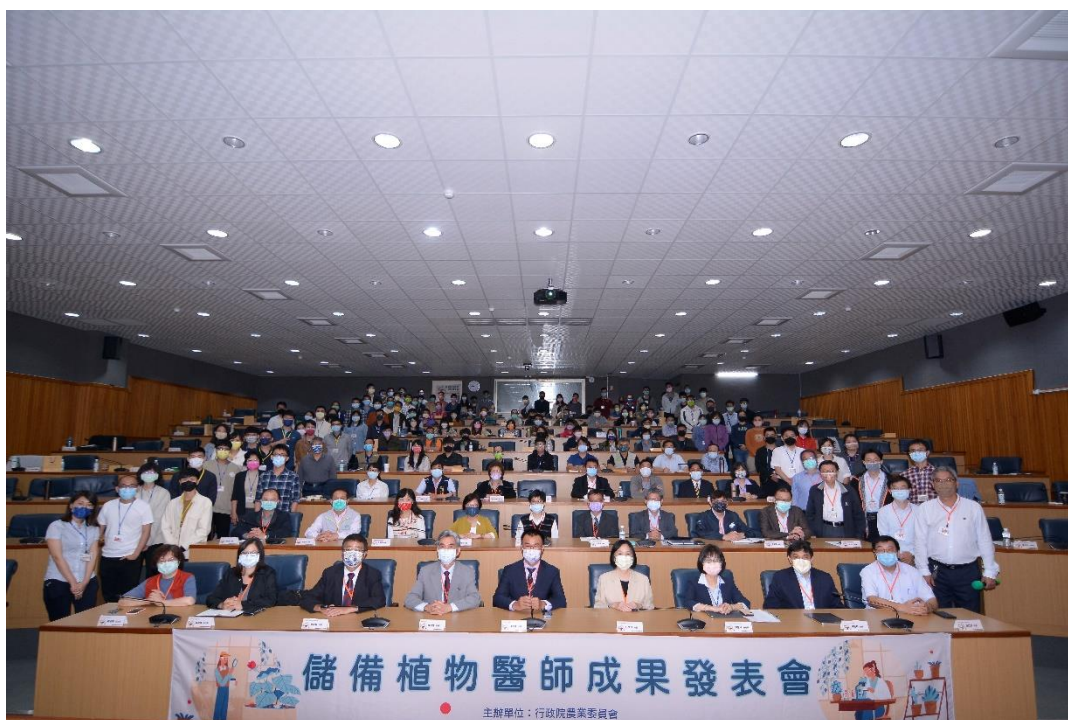
圖 9、於國立中興大學舉辦儲備植物醫師成果發表會。