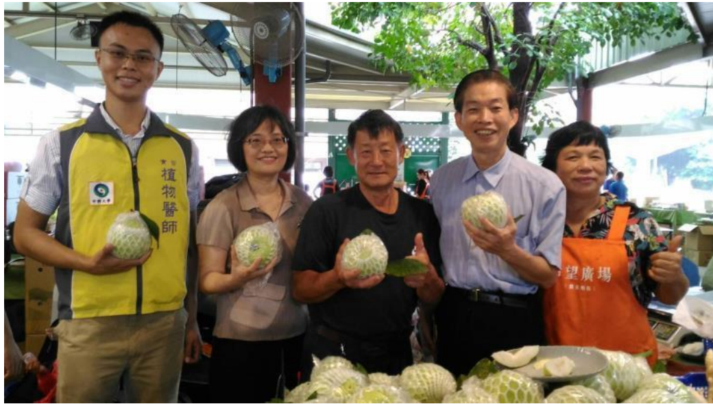
圖 3、媒體報導：植物醫師產地輔導農民在希望廣場展售優質農產品。