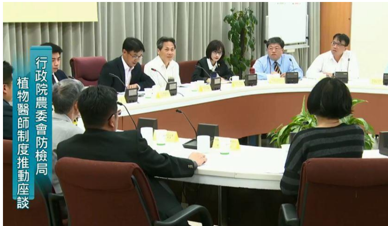
圖 1、防檢署邀請農企業、公民團體及四所大學植物保護相關科系專家學者，共同參與植物醫師制度推動座談會。