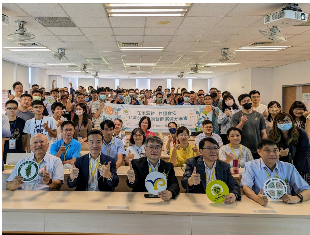
圖 10、於國立臺灣大學辦理儲備植物醫師案例分享會。