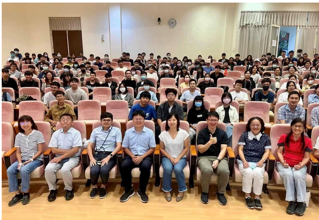
圖 11、辦理植物醫師制度推動現況說明會(國立屏東科技大學場)。