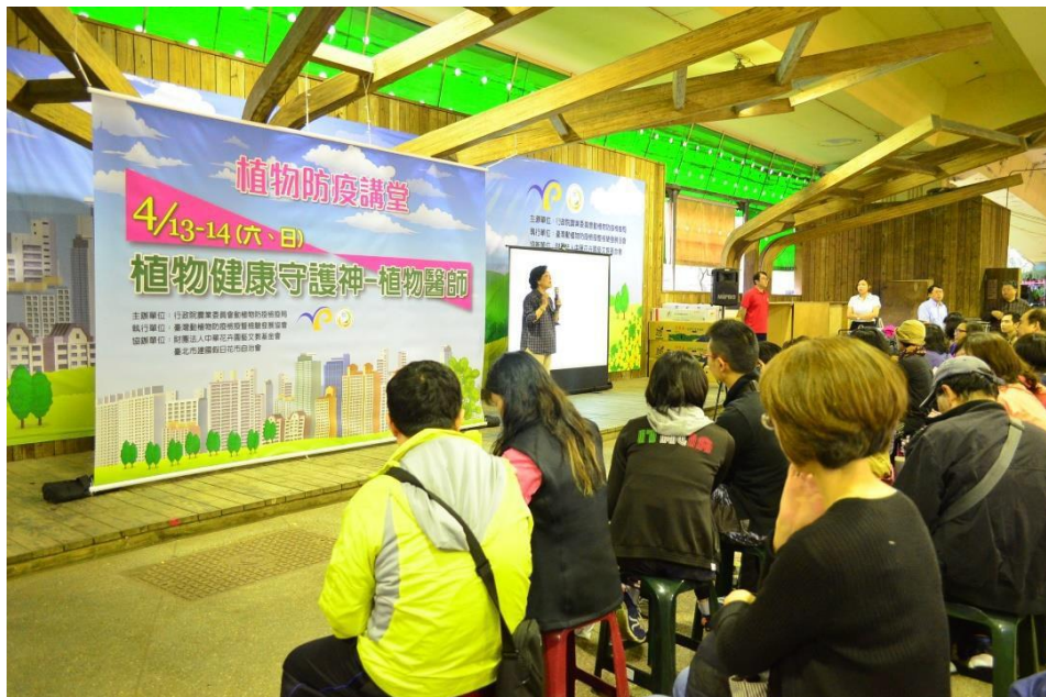
圖 2、於臺北市假日建國花市舉辦「植物防疫講堂」，增加民眾對植物醫師的認識。