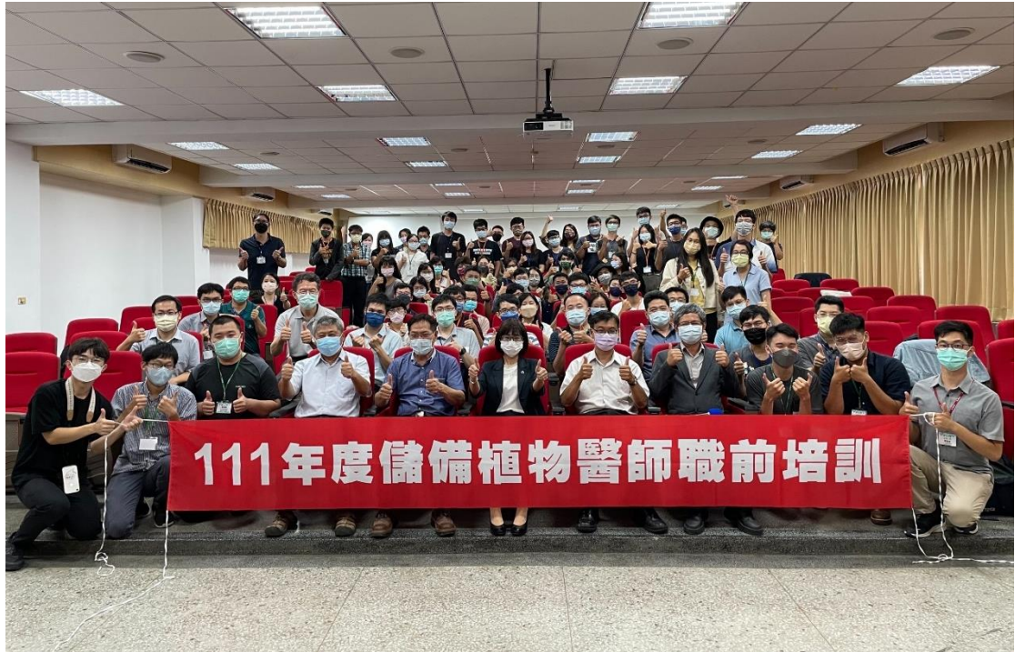
圖 5、111 年於國立嘉義大學舉辦「儲備植物醫師職前培訓」課程結訓典禮合影。