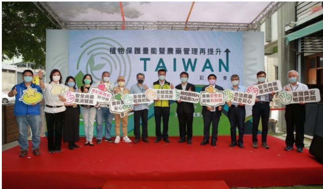
圖 6、於雲林縣莿桐鄉農會舉辦「植物保護量能暨農藥管理再提升」記者會。