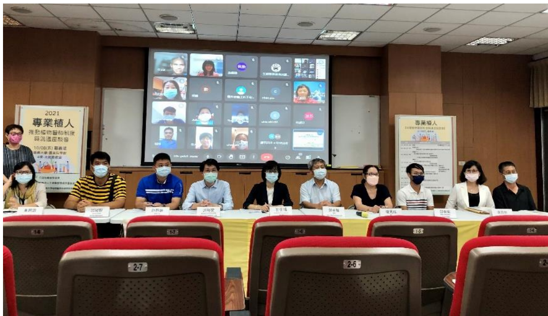
圖 8、主婦聯盟環境保護基金會於國立嘉義大學舉辦【專業植人】推動植物醫師制度與溝通座談會，蒐集利害關係人意見